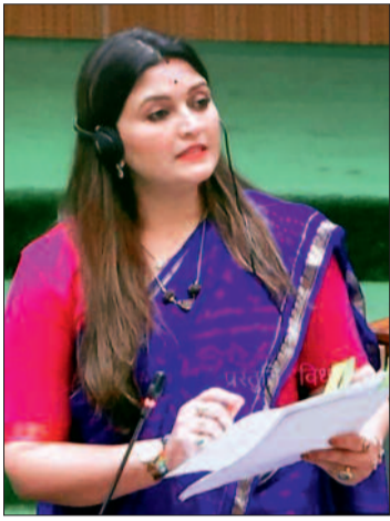
हरिभूमि न्यूज कवर्धा